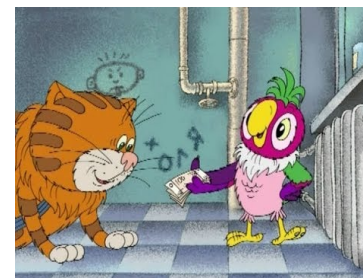
Проявления вербальной и (или) физической агрессии